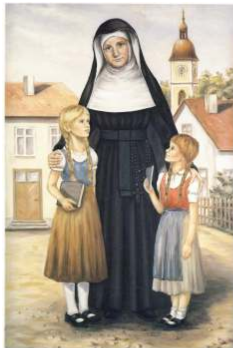
Umělec: Erich Klimek, Regensburg, 1985

Modlíme se, aby každý z nás byl plný pokoje, naděje a lásky. K tomu jsme byli povoláni a poslány.